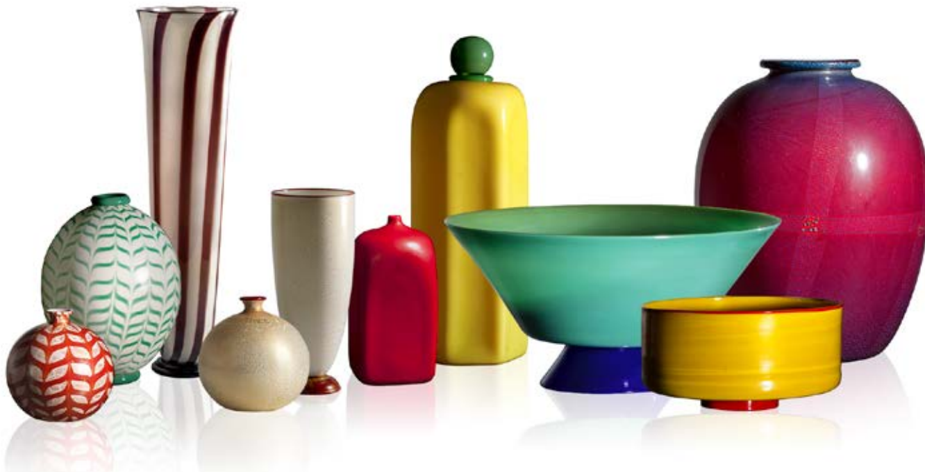
Vetri M.V.M. Cappellin & C., 1928-1931