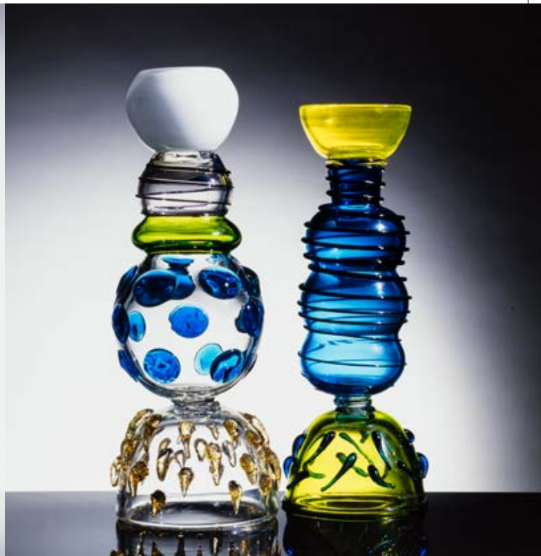
Ettore Sottsass, Sol e Sirio , 1982 e Alioth e Alcor , 1983, edizione Memphis Srl © Ettore Sottsass by SIAE 2017